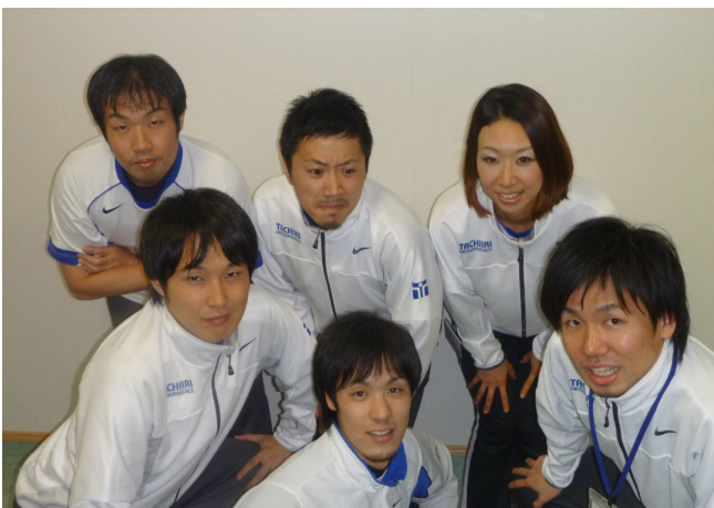
☆常勤 (外来担当) 理学療法士☆

当院での理学療法士の仕事は、大きくメデイカルリハビリとアシレッツクリハビリの二つを行なっています。メデイカルリハビリでは、疾病の治療を行ないながら日常生活の不自由を改善します。疾病の治療では、患者さん一人一人の病態に