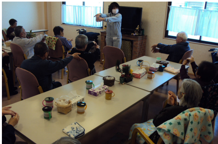
通所リハビリ(デイ・ケア)の様子

営業日：月曜日～金曜日 (年末年始・お盆・祝祭日を除く) 通所リハビリテーション 9:00～16:00 介護予防通所リハビリテーション 9:00～16:00